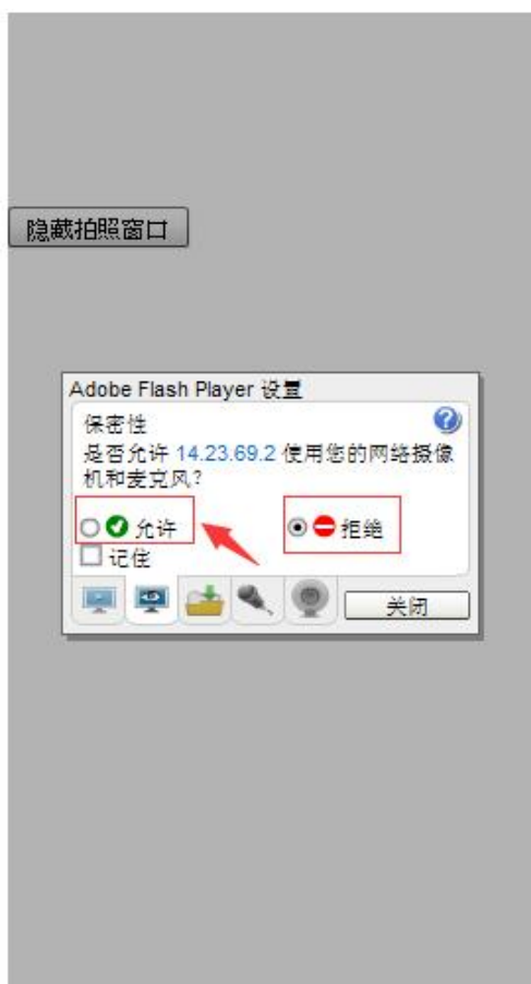
摄像头和麦克风设置窗口

点击【允许】，调好坐姿。为了方便观看视频，可以选择隐藏摄像头按钮（隐藏后仍会随机拍照）。