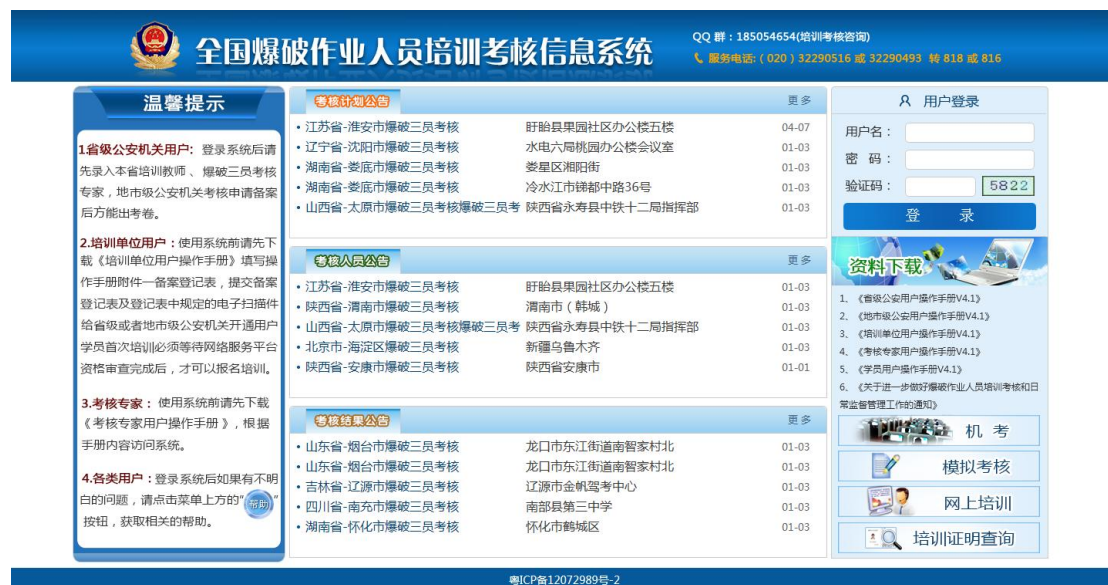
爆破作业人员培训考核管理信息系统页面

1. 在浏览器地址栏中输入网址： http://www.bpzykh.cn/ ，进入爆破作业人员培训考核管理信息系统页面，如下图所示：