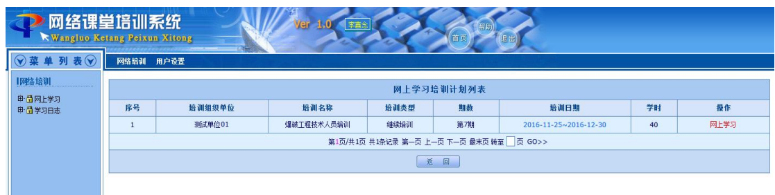
网上学习培训计划列表